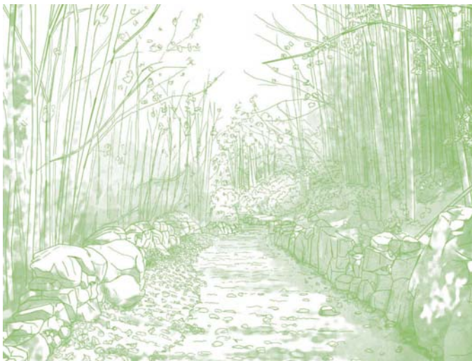
Caminhar na velha calçada medieval que ligava Castelo de Vide a Marvão.

É uma ligação histórica entre dois pontos estratégicos: Castelo de Vide e Marvão. Uma travessia secular ao longo de uma paisagem de características rurais e naturais, por antigos caminhos murados, com alguns setores ainda em calçada medieval.