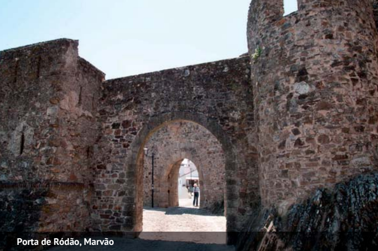
Porta de Ródão, Marvão