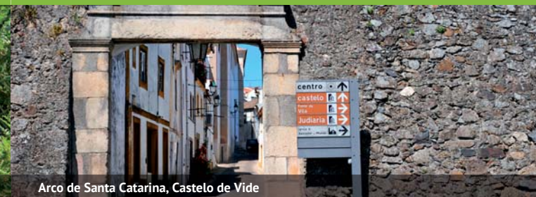
Arco de Santa Catarina, Castelo de Vide